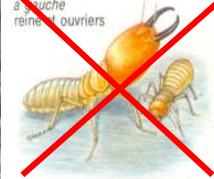
soldat et ouvrier